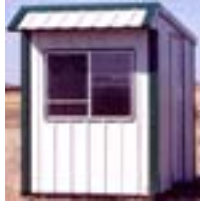
Ticket Booth. jpg