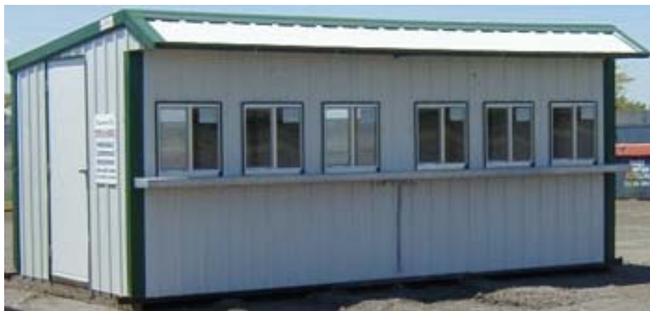
Ticket Booth 2.jpg

1 | 2 | 3 | 4 | 5 | 6 | 7 | 8 | 9 | 10 | 11 | 12 | 13 | 14 | 15 | 16 | 17 | 18 | 19