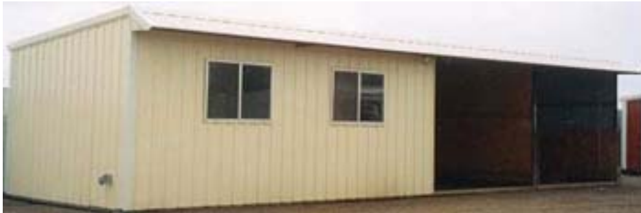
Custom Ranch 2.jpg

1 | 2 | 3 | 4 | 5 | 6 | 7 | 8 | 9 | 10 | 11 | 12 | 13 | 14 | 15 | 16 | 17 | 18 | 19